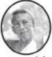
અદ્યાત્મ ધોગી આ.દે. શ્રીમદ્ વિજય કલાપૂર્ણસૂરિશ્વરજી મ.સા.