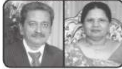
અ.સૌ. ઝવેરબેન ઉમરશી ભુરાલાલ સત્રા