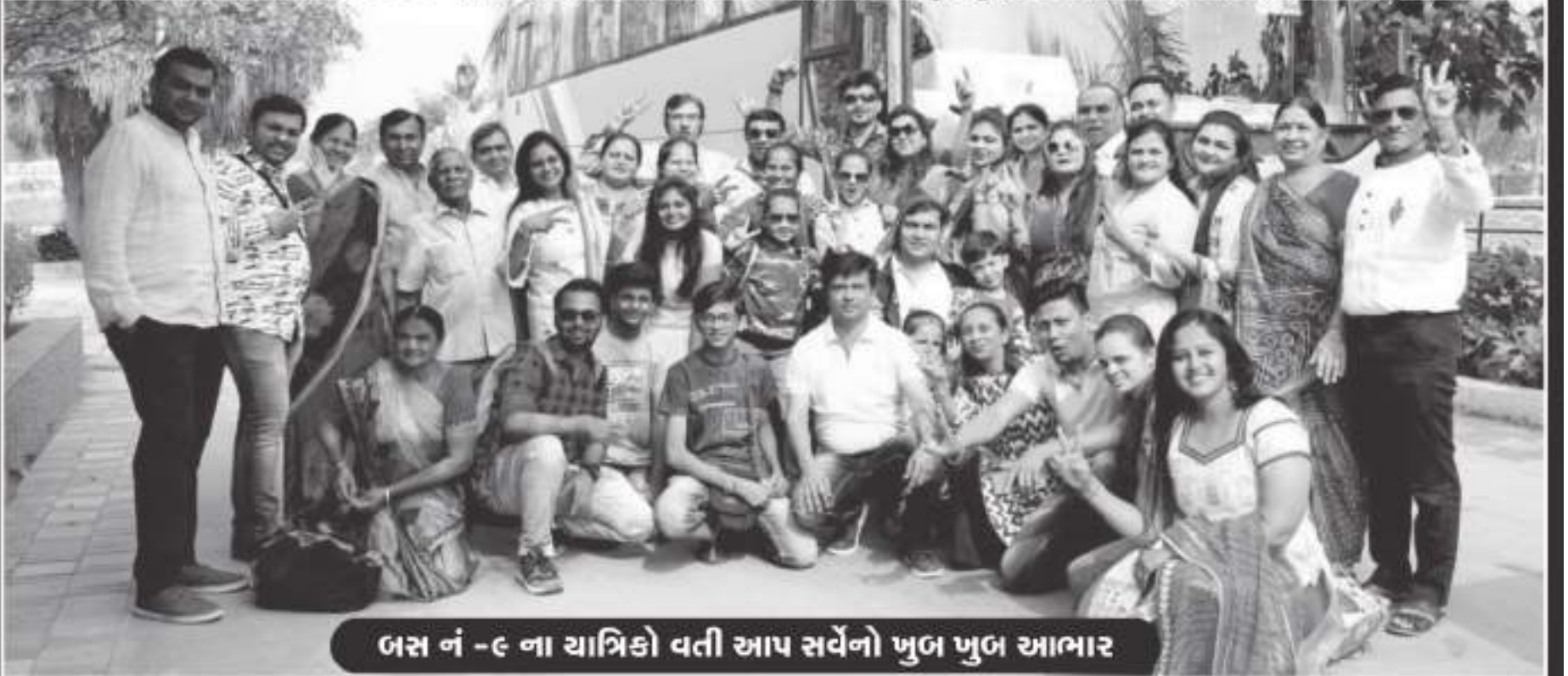
બસ નં - ૯ ના યાત્રિકો વતી આપ સર્વેનો ખુબ ખુબ આભાર

આવા જ યશસ્વી આયોજન અને અવ્યલ કાર્યો આપ કરતા રહો અને દક્ષિણ નો ડંકો પુરા મુંબઈ અને વાગડ મા વગાડતા રહો એવી શુભેચ્છા.